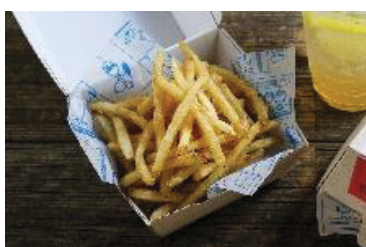
■ PEANUTS DINER -フレンチフライ