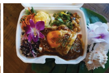
■ KAKA'AKO DINING & CAFÉ -ハワイアンBOX