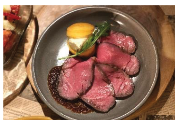
■ goodspoon -ローストビーフと フレッシュチーズ