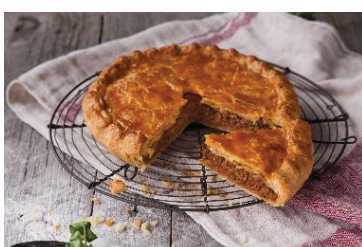
■ Pie Holic -カリフォルニアワインと ビーフミートパイのSet